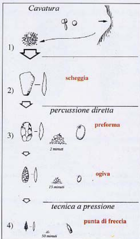
(Fig.2) Schema della catena operativa

Come spesso accade, in archeologia, dobbiamo ricostruire le attività, i gesti e le scelte dei gruppi umani sulla base di ciò che essi hanno scartato.