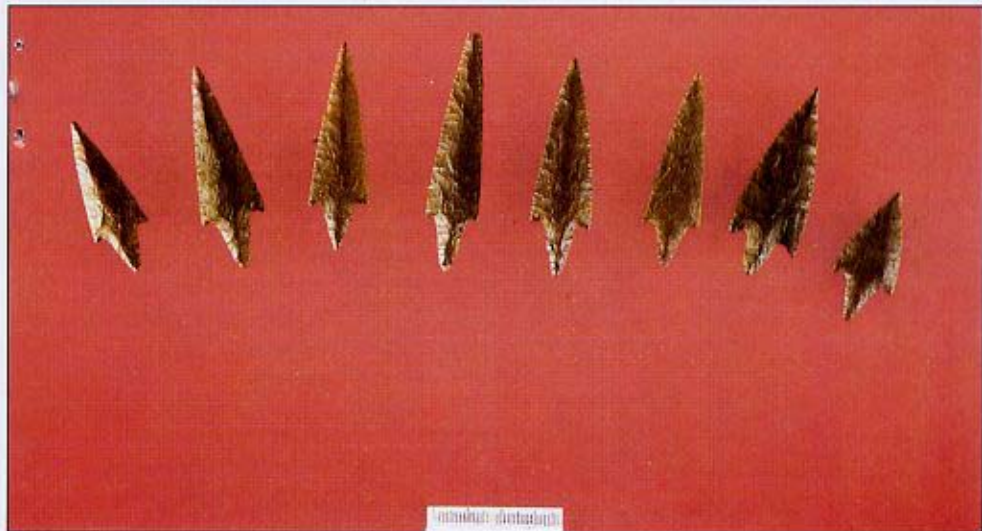
(Fig.4) Punta di freccia, di raffinata manifattura provenienti dal corredo sepolcrale della Grotta da Prima Ciappa in Val Frascarese e probabilmente prodotte con diaspro di Valle Lagorara

La catena operativa, ricostruita tramite l'analisi dei dati e supportata dalla sperimentazione, sembra orientata prevalentemente verso la produzione di questi bifacciali