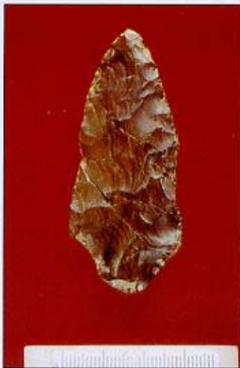
(Fig.3) Lama di pugnale in diaspro

ad una sommaria sbazzatura (2); successivamente si procedeva a una più accentuata riduzione del volume e dello spessore, con una scheggiatura su entrambe le superfici, fino a realizzare le ogive. Queste venivano ulteriormente rifinite mediante ritocco ben organizzato, bifacciale, che veniva realizzato con percussori più piccoli e costituiti da roccia più tenera, quale per esempio il calcare, o forse da corna di cervo o legno duro (3). Le ogive dovevano essere poi trasformate in punte di freccia, mediante ritocco a pressione, effettuato con una punta in rame o in corno (4). (Fig. 2)