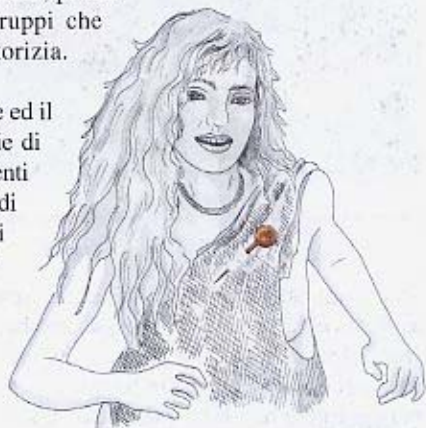
(Fig. 2) Gli spilloni probabilmente venivano appuntati sulle vesti di pelle o di lana

L'abbandono della cava fu probabilmente conseguenza del fatto che, a parti-