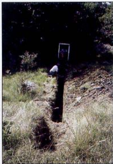
(Fig. 3) La trincea effettuata a monte del masso, in corso di scavo

E' di nuovo testimoniata una frequentazione abbastanza intensa della valle a partire dal 500 d.C., quando il crollo dell'impero romano e del suo sistema economico portò ad un nuovo interesse verso le risorse agropastorali della Liguria montana.