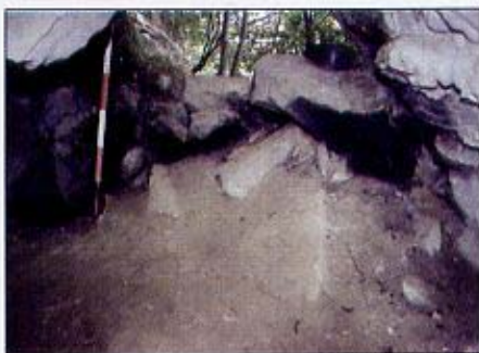
(Fig. 1) L'ingresso della Tana del Bandito

La piccola cavità (Fig. 1) che si apre nei calcari alla sommità del Monte Scogliera, la Tana del Bandito, ha restituito informazioni su quella che doveva essere la vita dell'uomo nella valle prima dell'attivazione della cava.